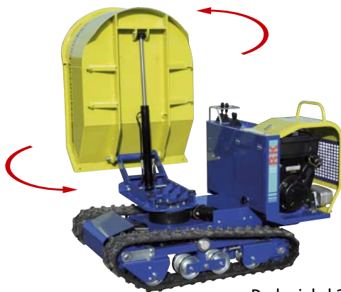
Drehwinkel 2 x 90°